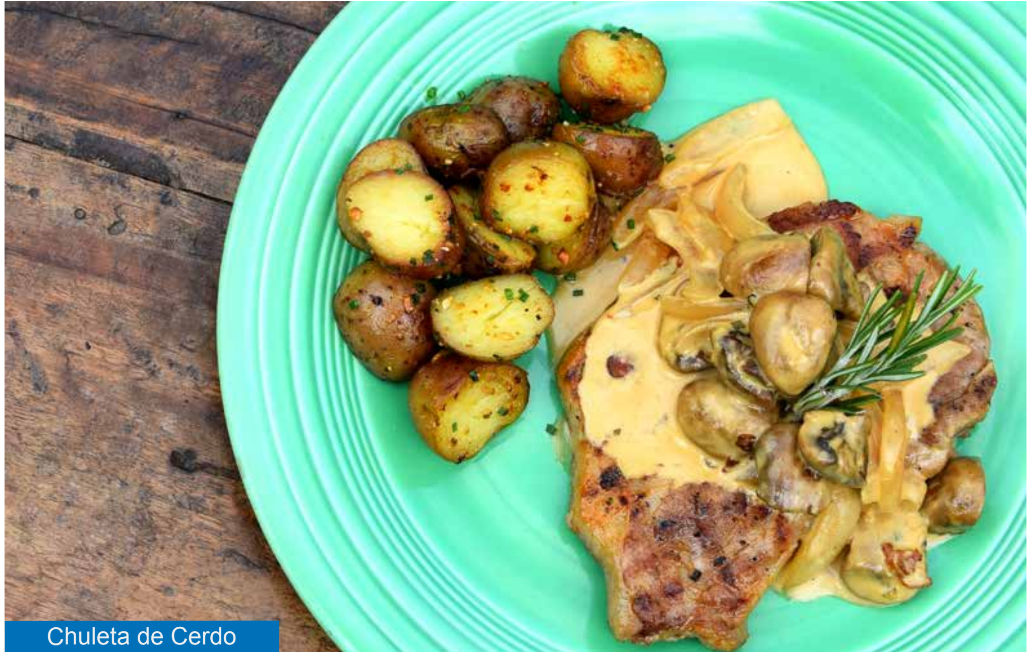
Chuleta de Cerdo

RECÍBELO en la tarde del Jueves 15 de Dic/22