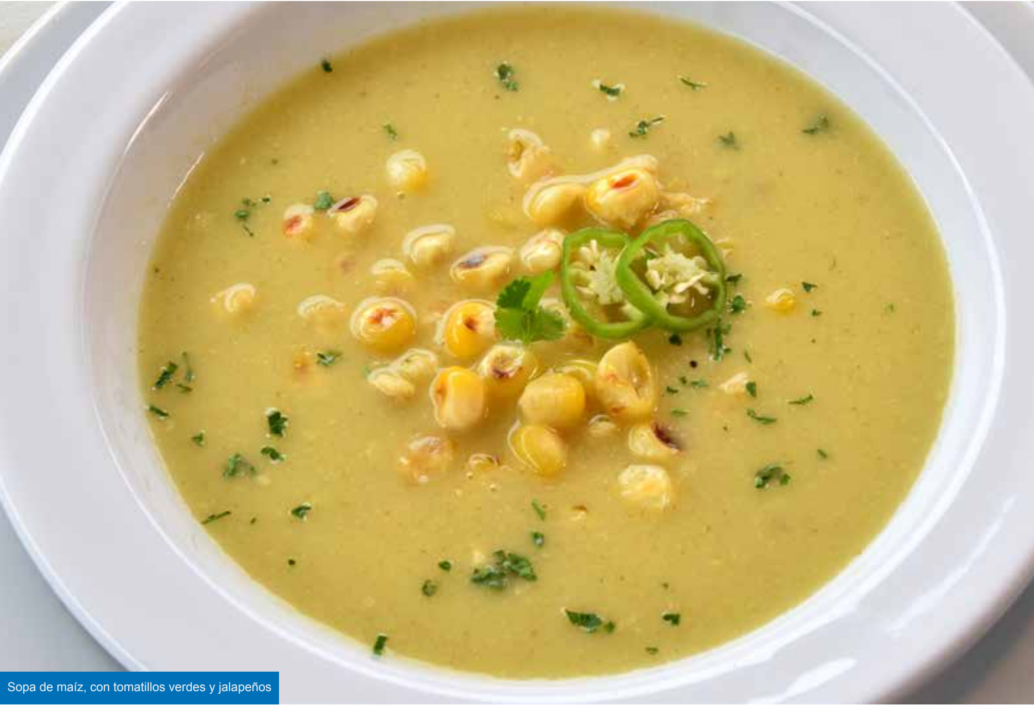
Sopa de maíz, con tomatillos verdes y jalapeños

RECÍBELO en la tarde del Jueves 15 de Dic/22