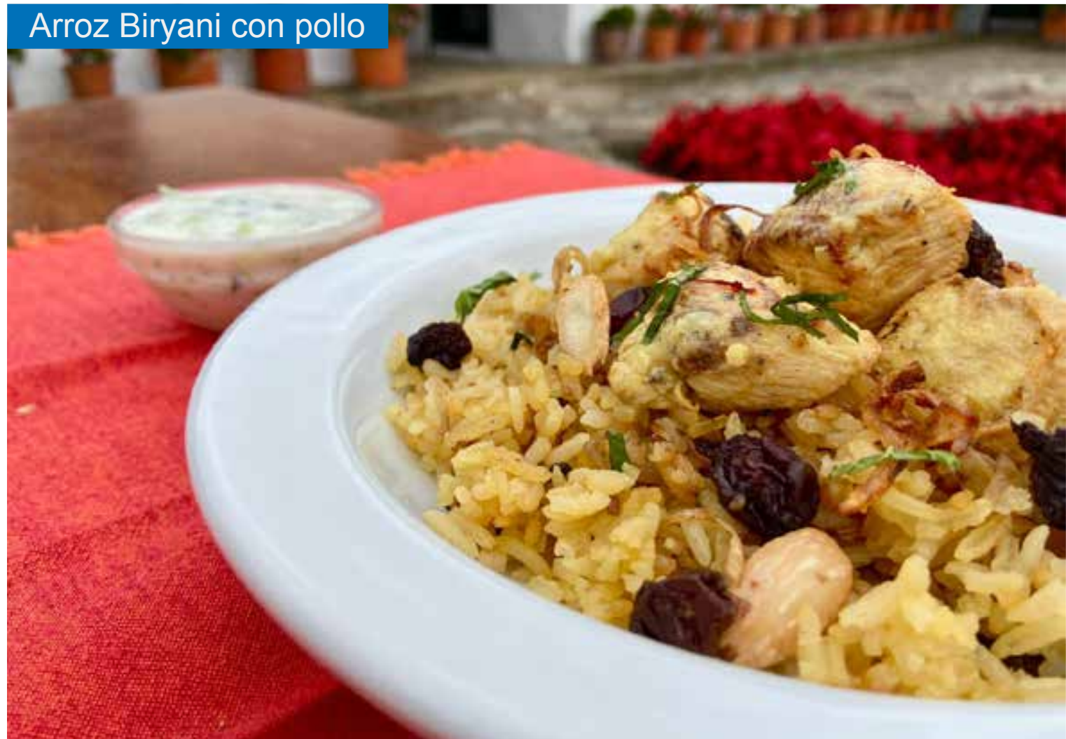
Arroz Biryani con pollo