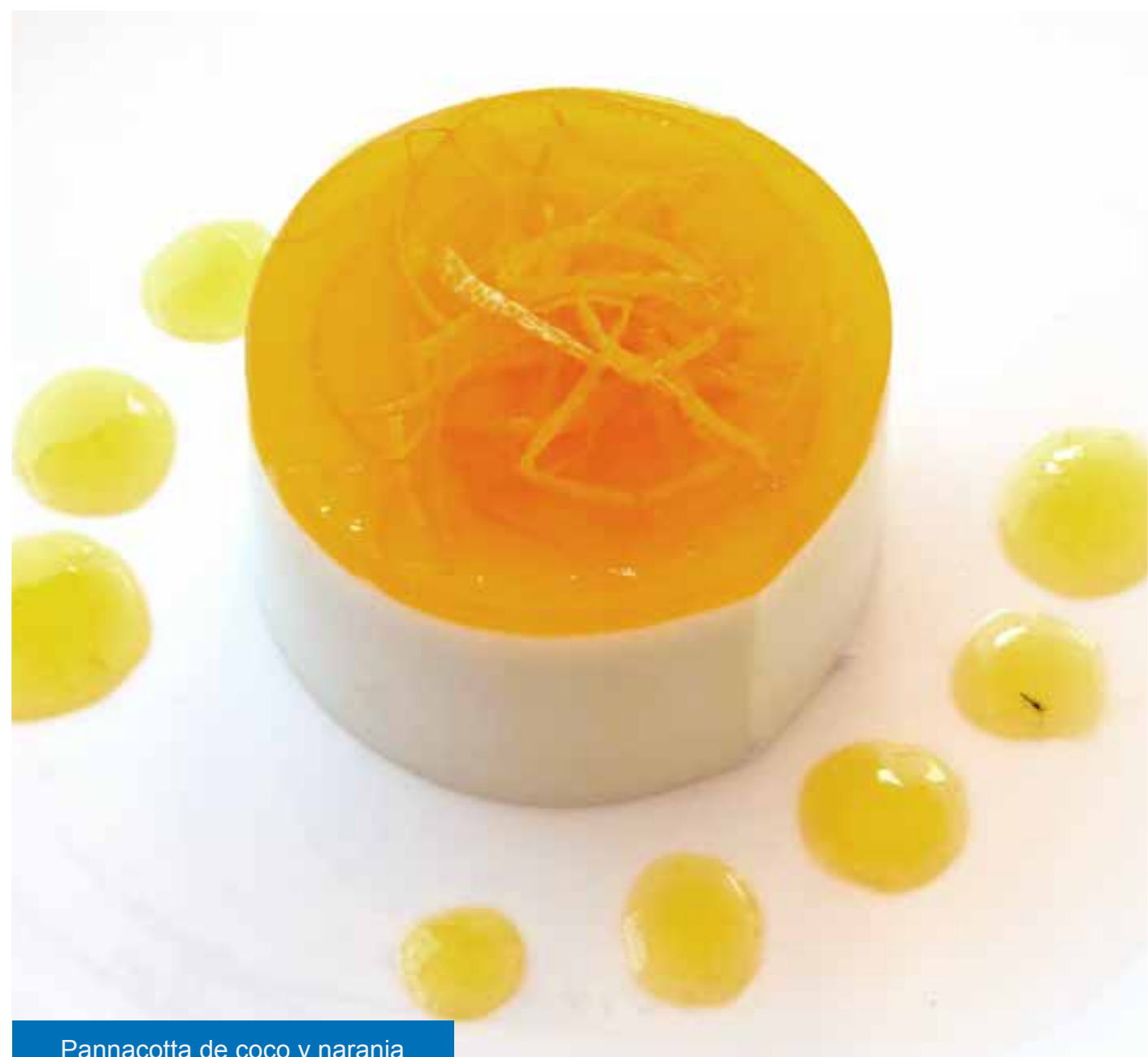
Pannacotta de coco y naranja