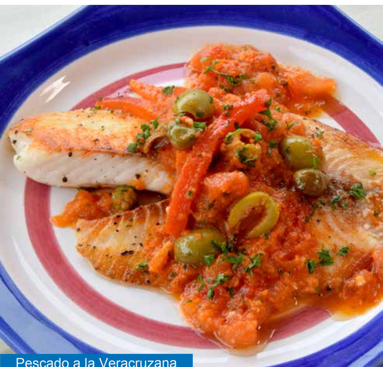
Pescado a la Veracruzana