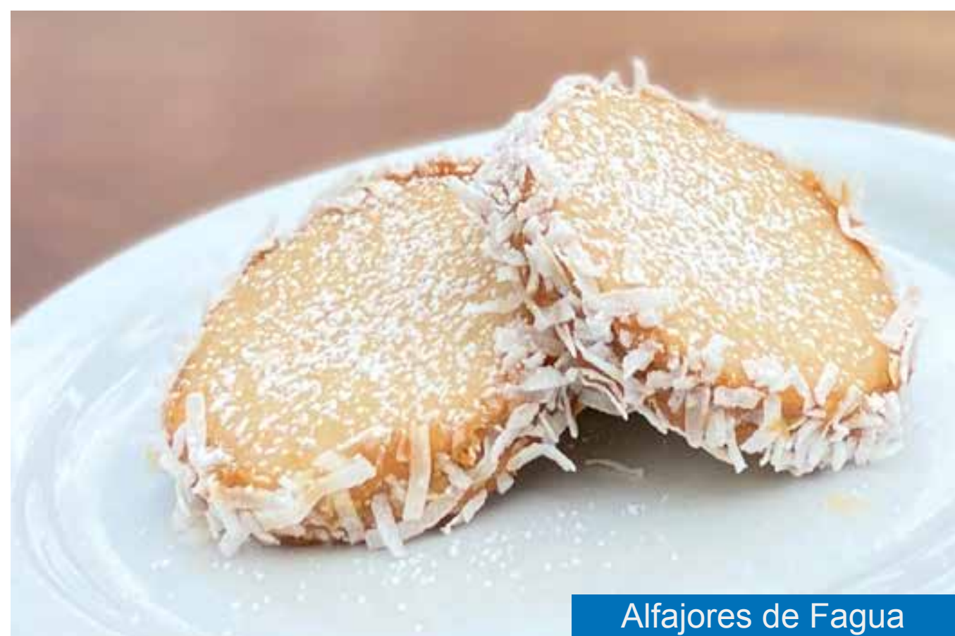
Alfajores de Fagua

PAGA ONLINE (Pedido mínimo de $50.000) - Domicilios: Bogotá y Chía: $12.000 Cajicá y Tabio: $19.000 RESERVA TU PEDIDO WP 322 951 6643 - 310 880 2443 - 310 817 1080 comercial@fagua.com - www.fagua.com