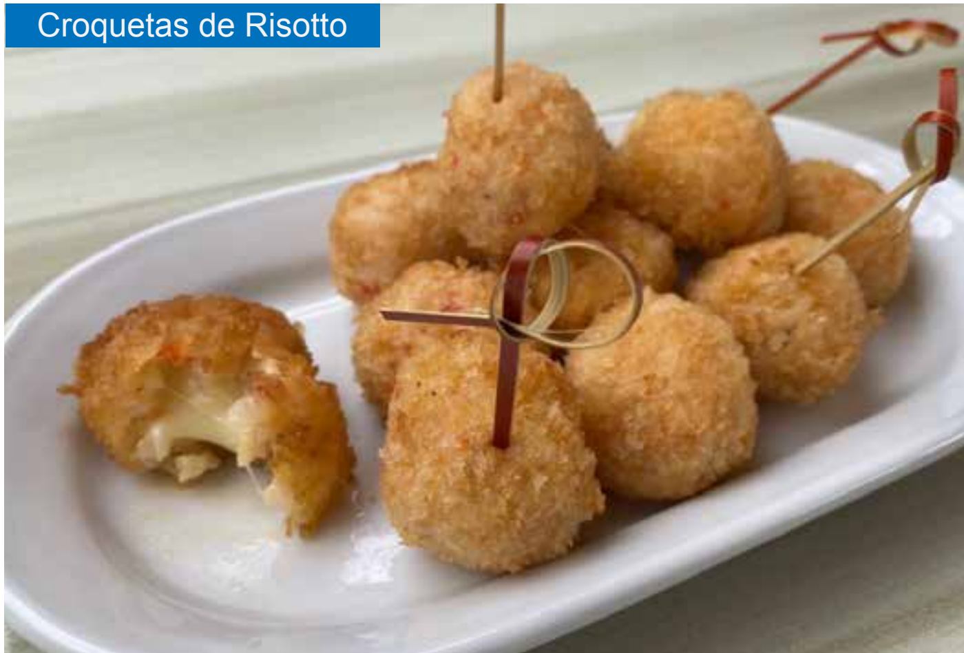
Croquetas de Risotto

PAGA ONLINE (Pedido mínimo de $50.000) - Domicilios: Bogotá: $11.000 Cajicá, Tabio y Chía: $9.000