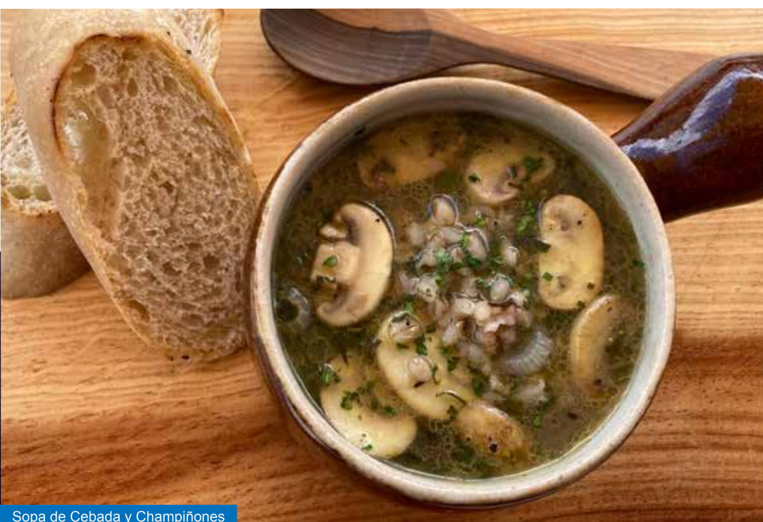
Sopa de Cebada y Champiñones