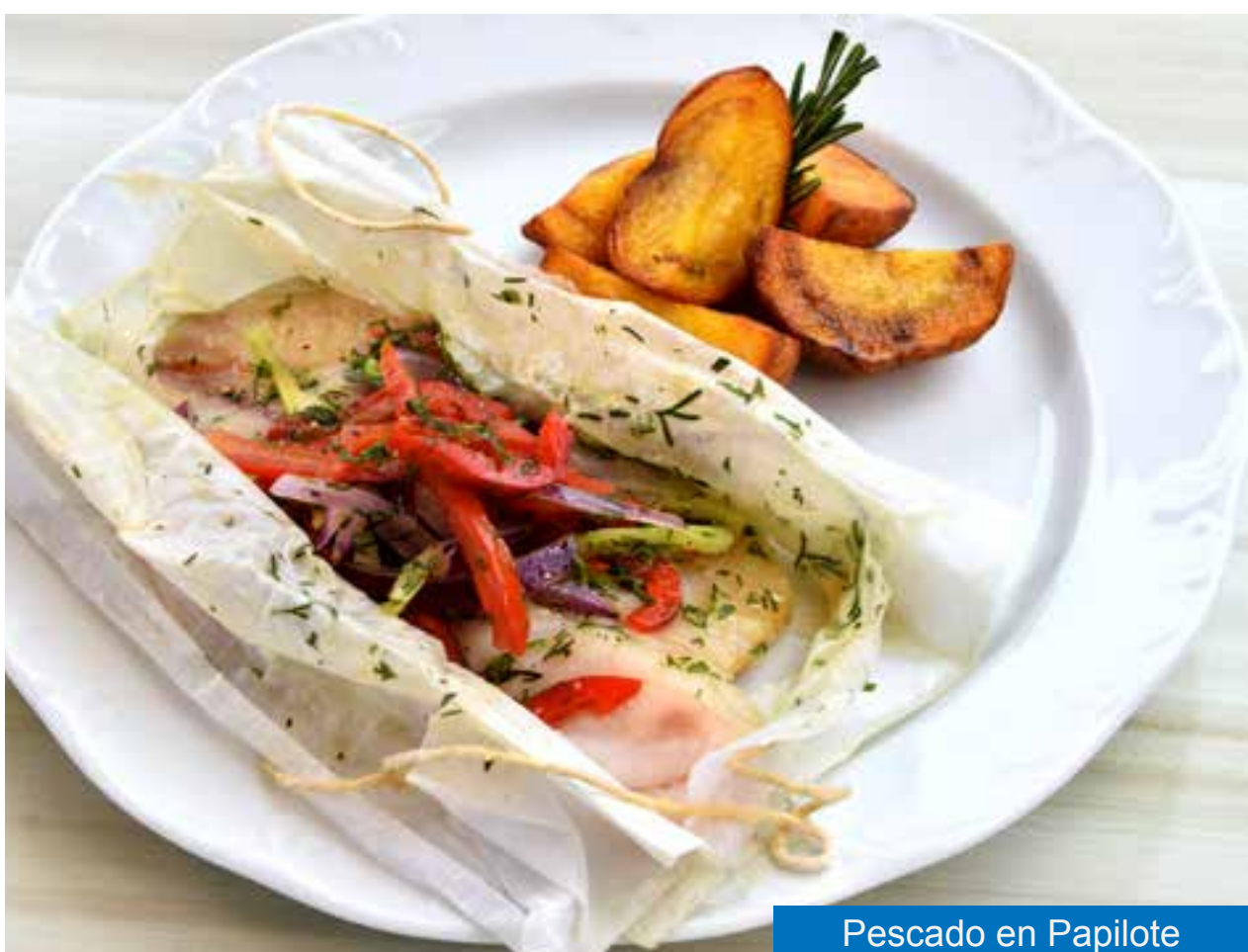
Pescado en Papillote

PÍDELO hasta el martes 25 de Enero/22 RECÍBELO en la tarde del jueves 27 de Enero/22